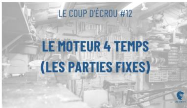
□ Le coup d'écrou #12 - Le moteur 4 Temps / Les organes (parties fixes) 16 Oct 2020