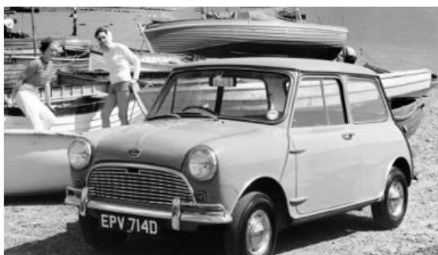
La Mini : maxi révolutions 15 Oct 2020