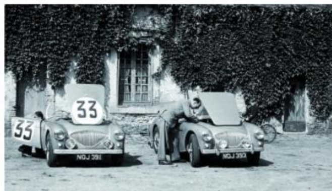
Une Healey spéciale... 29 Oct 2020