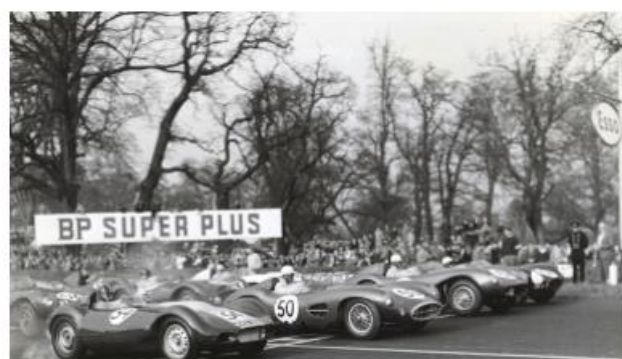
Lister : Quand le coup de foudre devient éclair de génie - Partie 1