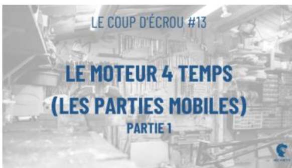
□ Le coup d'écrou#13 - Le moteur 4 temps / Les parties mobiles (Partie 1)