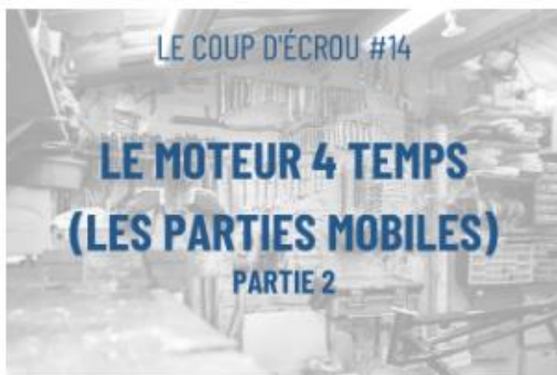
□ Le coup d'écrou#14 - Le moteur 4 temps / Les parties mobiles (Partie 2)