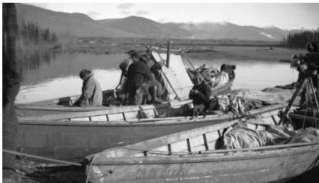
Coup d'oeil dans rétro#14 - La Croisière Blanche Partie 4 19 Oct 2020