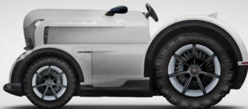
Porsche Mission E Tractor